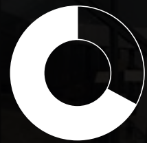
Avant la Directive sur l'efficacité énergétique dans les bâtiments 1993