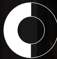
Après la Directive sur l'efficacité énergétique dans les bâtiments 2002